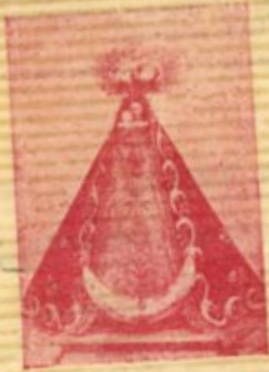
NUESTRA SEÑORA DE LA LUZ PATRONA PRINCIPAL DE ALCONCHEL (BADAJOZ)